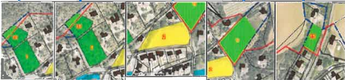
terrain 16 (A 972)